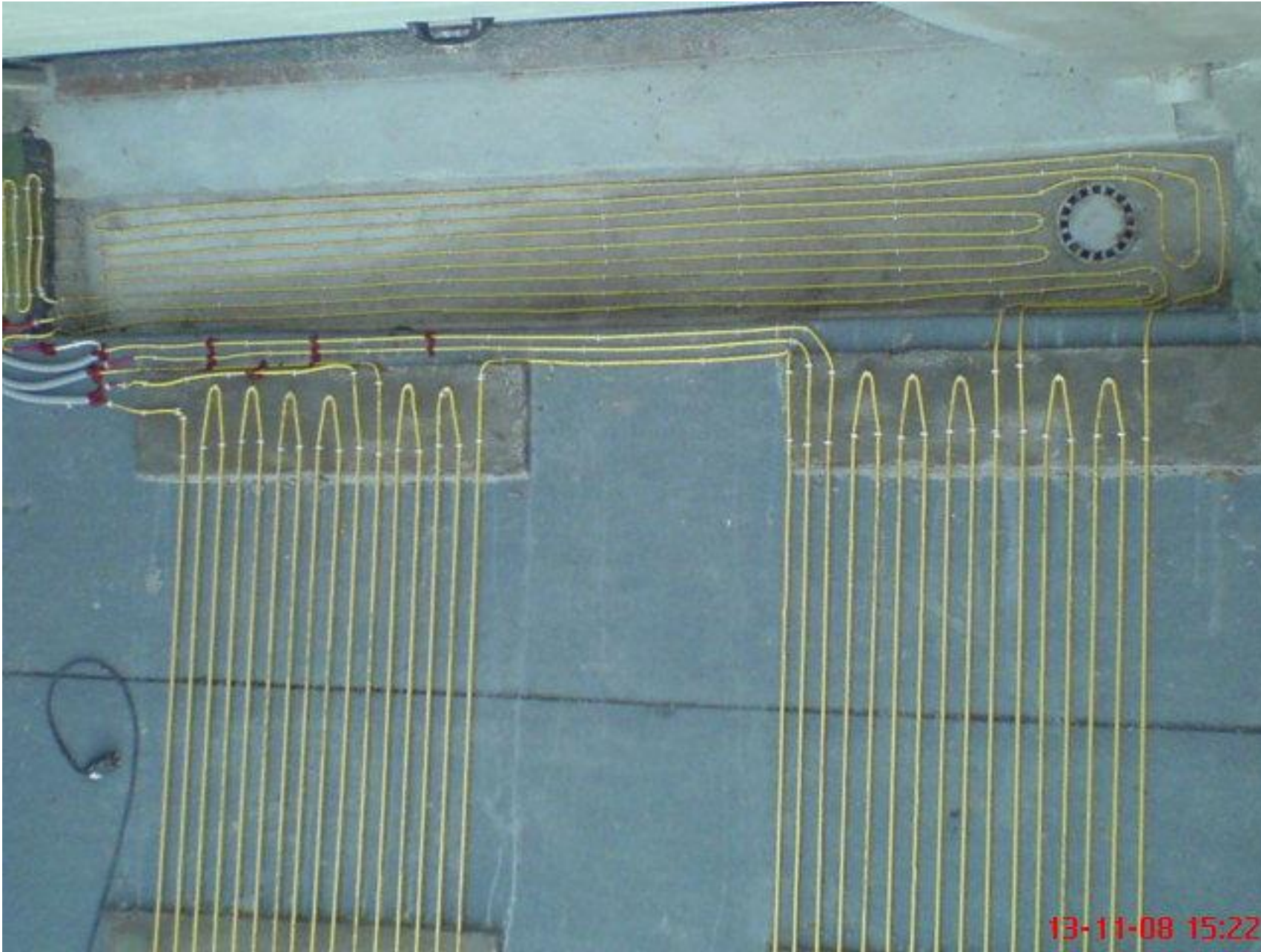
Rampa sonundaki süzgeç uygulaması